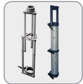
سنون قابل انتخاب