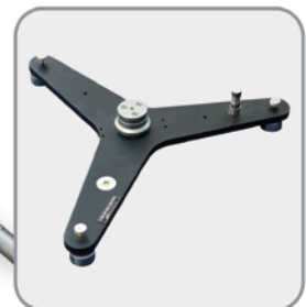
پایه نگهدارنده سنون